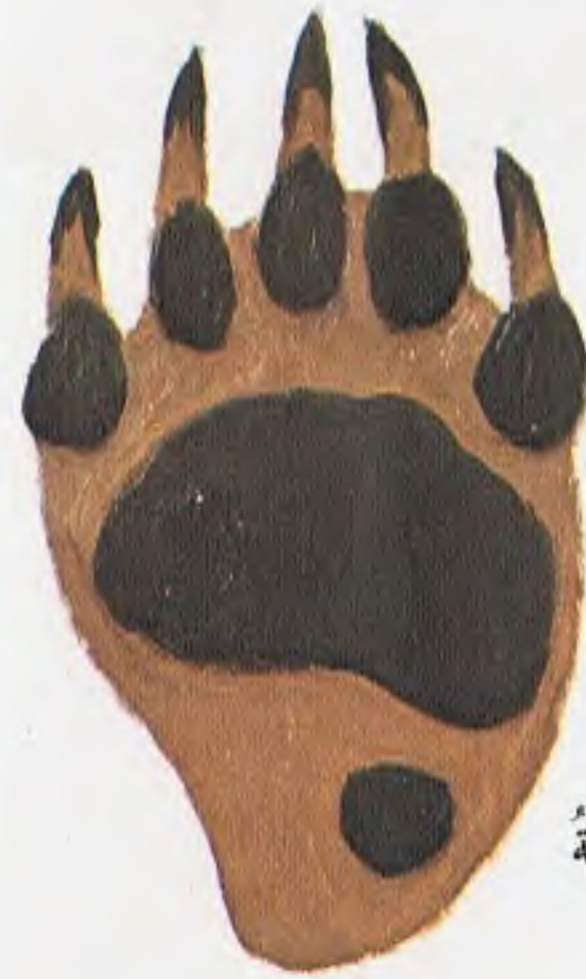
الْقَدَمُ الْأَمَامِيَّةُ الْيُمْنَى

وَقَدْ أَصْطَلِحَ عَلَى اسْتِعْمَالِ لَفْظَةِ «قَارِتٍ» لِوَصْفِ الْحَيَوَانَاتِ الَّتِي يَأْكُلُ أَنْوَاعًا مُخْتَلِفَةً مِنَ الطَّعَامِ ، كَالدَّبِّ .